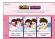
[교사용] 멘토링 화보